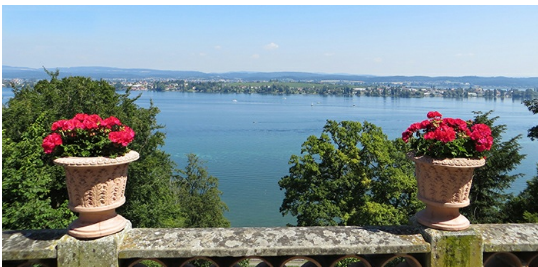
Abb: Das Vertiefungsseminar und auch das Empathische Counselling finden im Bildungszentrum Arenenberg statt, mit herrlicher Lage am Bodensee.